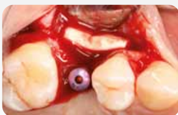
Two layers of OSSIX® VOLUMAX were applied- No bone graft