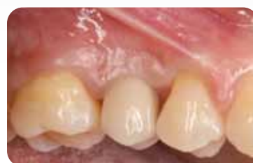
Final restoration – 6 months