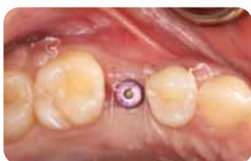
Good maturation of the soft tissue and thickening of the mucosa