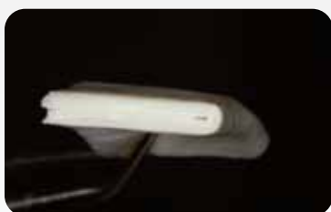
OSSIX® VOLUMAX was folded and applied as a double layer